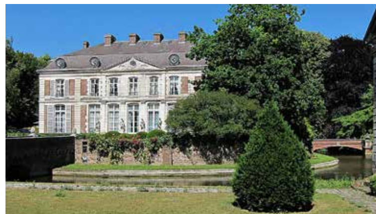
Château du Vert bois