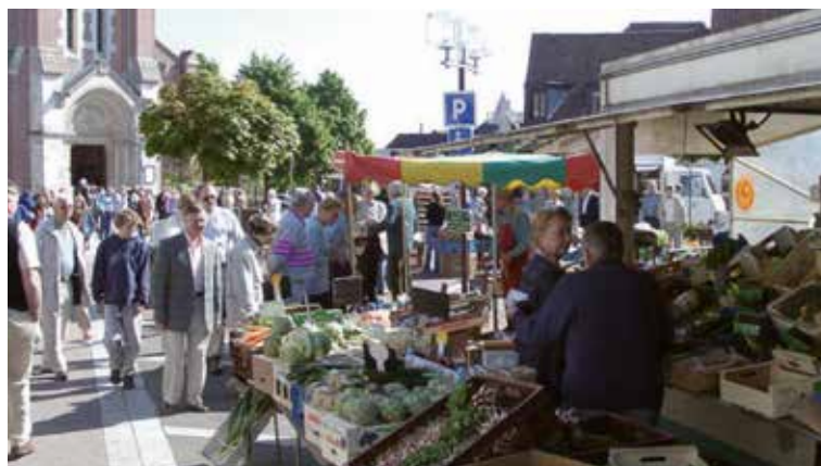
Marché de Bondues