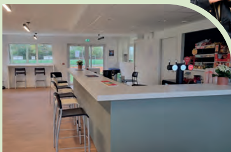
Inauguration du 4 décembre