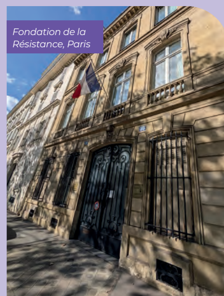
Fondation de la Résistance, Paris

continue ainsi de se dévoiler, permettant à ces résistants de retrouver peu à peu leur nom et leur place dans la mémoire collective.